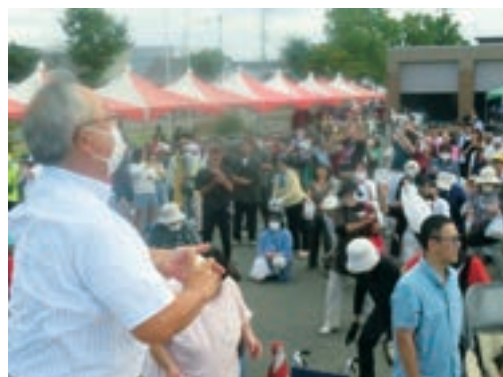
昨年の餅まきの様子

今年も右のように様々なプログラムを予定しております。子どもから大人まで楽しめる内容となっているので、ぜひお越しください！