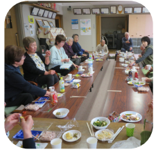
食事会 (ふれあいいきいきサロン)