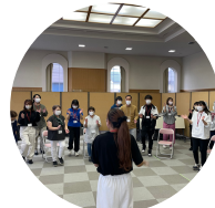
学生との交流企画