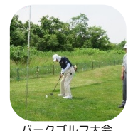
パークゴルフ大会